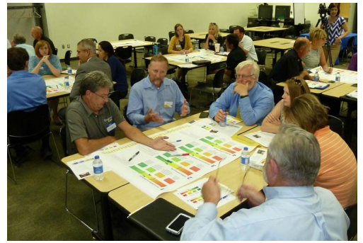
Taller de las partes interesadas el 10 de Agosto

El Taller No. 2 de las partes interesadas se llevó a cabo el 10 de agosto de 2015 para discutir cómo la red de caminos, senderos y carriles de la zona de Grand Island deberán desempeñarse para los automovilistas, ciclistas, caminantes, y otros en los próximos 25 años, en relación con las posibles metas y objetivos para el plan JOURNEY 2040 . Los participantes del taller discutieron la importancia del desarrollo de posibles objetivos y medidas de desempeño a través del transporte, las iniciativas locales para la creación de comunidades saludables, y el impacto de la financiación que pueden tener en las aspiraciones de transporte de la zona.